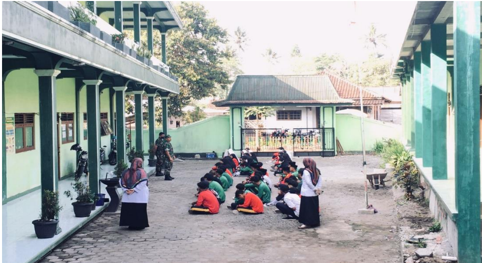
Gambar III.7 Latihan dasar kepemimpinan dewan penggalang dan osis MTs Mu'allimin Mudal bersama kodim