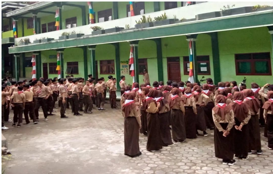
Gambar III.8 Kegiatan pramuka peserta didik MTs Mu'allimin Mudal

Dari hasil analisis peneliti dapat disimpulkan bahwa lingkungan akademis MTs Mu'allimin Mudal dibagi menjadi lingkungan iklim dan budaya madrasah, adapun iklim madrasah sangat berhawa sejuk karna lingkungan madrasah dikelilingi pepohonan yang rindang dan terasa nyaman karna jauh dari suara bising kendaraan bermotor, lingkungan budaya MTs Mu'allimin Mudal sendiri terbagi menjadi kegiatan intrakulikuler dan kegiatan ekstrakulikuler madrasah. Kondisi iklim dan berbagai kegiatan tersebut diharapkan dapat menambah motivasi siswa dalam belajar sudah cukup sesuai dengan kebutuhan madrasah.