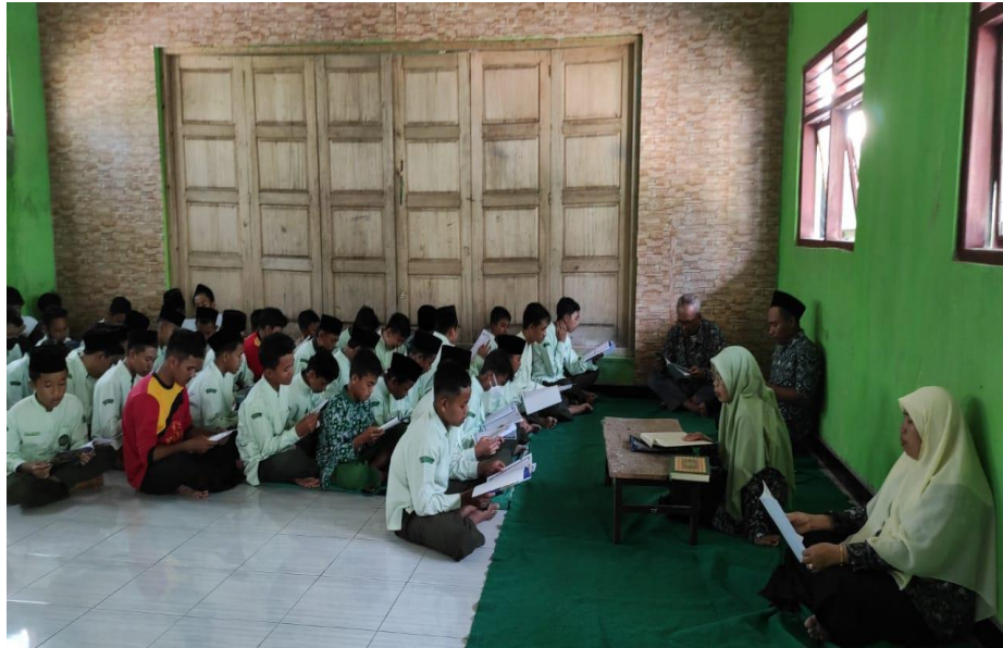
Gambar III.5 Kegiatan khotmil Quran oleh guru dan peserta didik MTs Mu'allimin Mudal