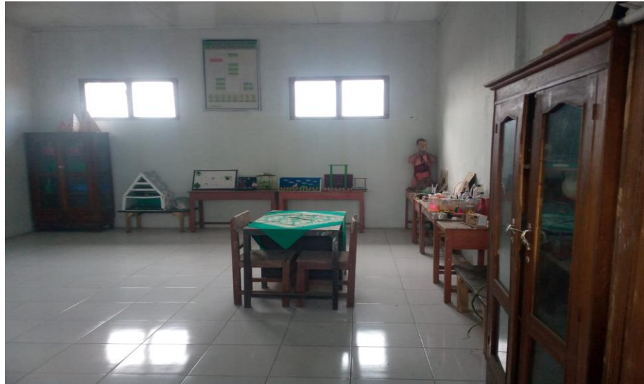
Gambar III.7. Laboratorium IPA MTs Mu'allimin Mudal