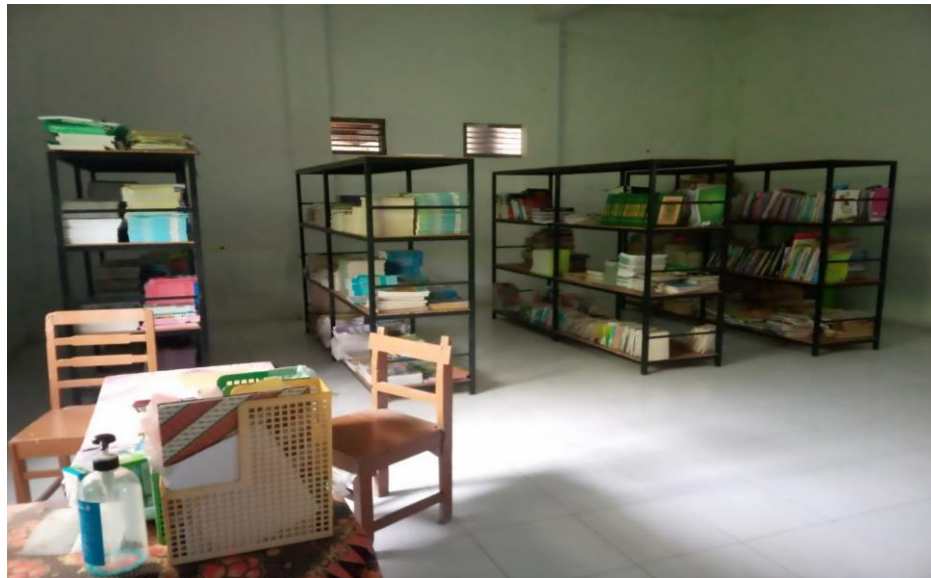
Gambar III.8. Perpustakaan MTs Mu'allimin Mudal

Dari pernyataan tersebut dapat disimpulkan bahwa lingkungan fisik madrasah memberikan dampak yang penting pada pengalaman belajar peserta didik. Maka dari itu lingkungan madrasah merupakan salah satu prioritas utama yang harus diperhatikan, sangat jelas bahwa baik secara langsung maupun secara tidak langsung kondisi fisik lingkungan madrasah dapat mempengaruhi meningkat dan menurunnya motivasi peserta didik dalam belajar. Baik dari keadaan sarana prasarana madrasah, kondisi sekitar madrasah ataupun masyarakat sekitar madrasah, itu merupakan bagian dari lingkungan madrasah. Dari analisis peneliti menyimpulkan bahwa MTs Mu'allimin Mudal memiliki kondisi lingkungan yang cukup kondusif dan sudah cukup sesuai dengan kebutuhan madrasah.