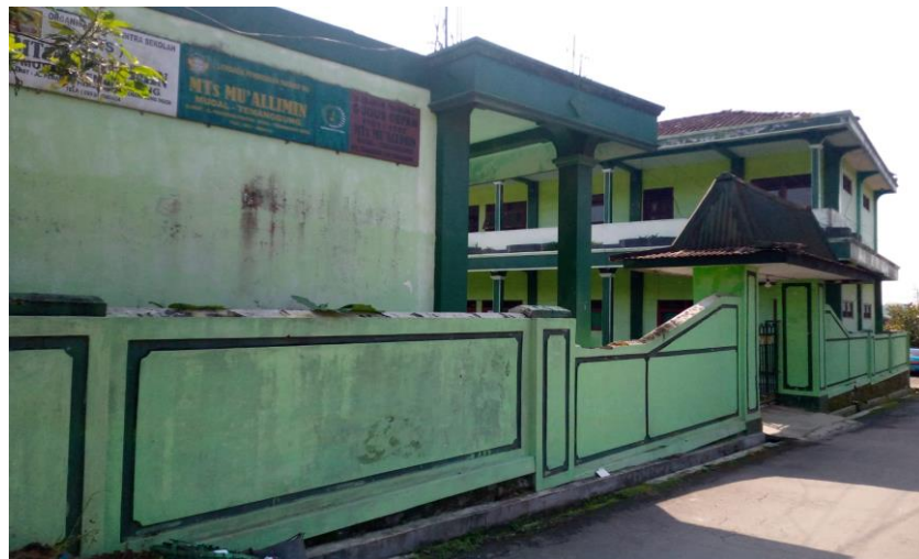
Gambar III.5. MTs Mu'allimin Mudal Tampak Samping

Lingkungan fisik madrasah berupa sarana prasarana, dan kondisi di sekitar sekolah. Sarana dan prasarana pendidikan yang meliputi ruang kelas, perpustakaan, laboratorium, peralatan dan media pembelajaran yang memadai, serta kondisi disekitar sekolah yang kondusif. Kondisi tersebut akan membawa peserta didik pada proses pembelajaran yang efektif. Berdasarkan hasil observasi peneliti letak MTs Mu'allimin Mudal juga sangat strategis, MTs Mu'allimin Mudal terletak di dekat jalan sehingga memudahkan peserta didik dalam mendapatkan akses pendidikan, MTs Mu'allimin Mudal tidak terlalu dekat dengan jalan raya, sehingga membuat suasana belajar peserta didik lebih aman dan nyaman karena terhindar dari kebisingan suara kendaraan. Seperti yang dinyatakan oleh kepala tata usaha, bahwa kondisi Lingkungan madrasah MTs Mu'allimin Mudal sangat nyaman dan asri karena belum tercemar polusi dan jauh dari suara bising yang disebabkan oleh suara kendaraan bermotor, jadi siswa bisa berkonsentrasi penuh dalam proses pembelajaran.