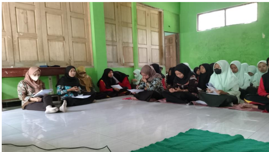
Gambar III.6 Kegiatan mujahadah oleh peserta didik dan guru MTs Mu'allimin Mudal