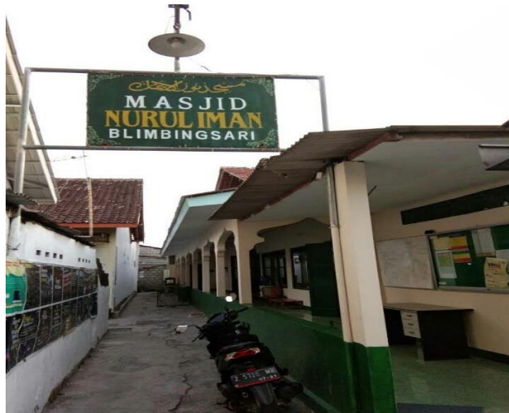
Gambar 2.1 Lokasi Penelitian