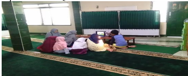
Gambar 2.2 Subjek Penelitian

Jumlah siswa tingkat B adalah 15 orang yang terdiri dari laki-laki dan perempuan. Pengambilan subjek penelitian ditentukan berdasarkan kurang inovatifnya pembelajaran di TPA/TPQ. Objek penelitian ini adalah strategi pembelajaran ISC untuk mempelajari korelasi sains dengan ayat Alquran di TPA/TPQ.